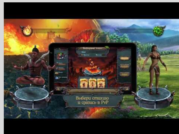
Двойной клик для воспроизведения