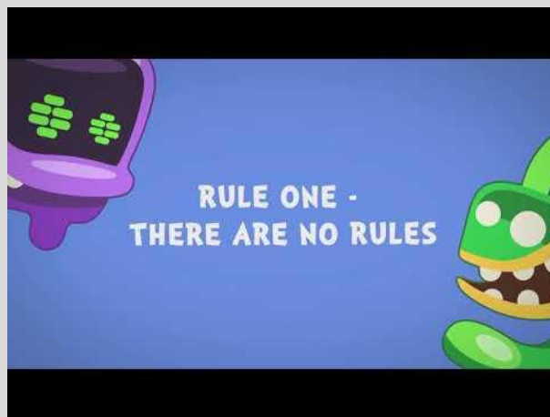
Двойной клик для воспроизведения